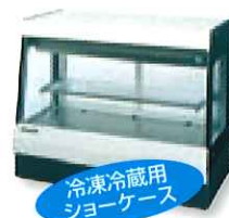
冷凍冷蔵用 ショーケース